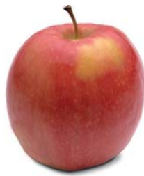
Pink Rosée (aromática)