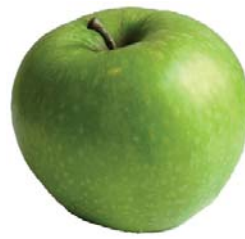
Granny Smith (ácida)